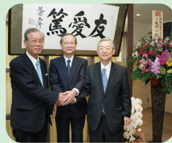
小田(前)市長と共に