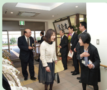
多くの方で賑わうエントランス

安全かつ機能的に設計された保育室や居室、光あふれるデイサービスなど、皆様からは「素晴らしいですね」との声もいただきました。