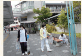
リハビリ科、看護部など清掃中のスタッフたち

毎年、長岡京市が行う美化活動ですが、コロナ禍で休止中。今年は、開催の運びとなり、千春会も例年通り各部署が参加し、病院近辺、交差点、駅前を清掃しました。最近では、様々な工事も多いのですが、常に近隣の清掃を心がけ、さらに継続した美化に努めてまいります。