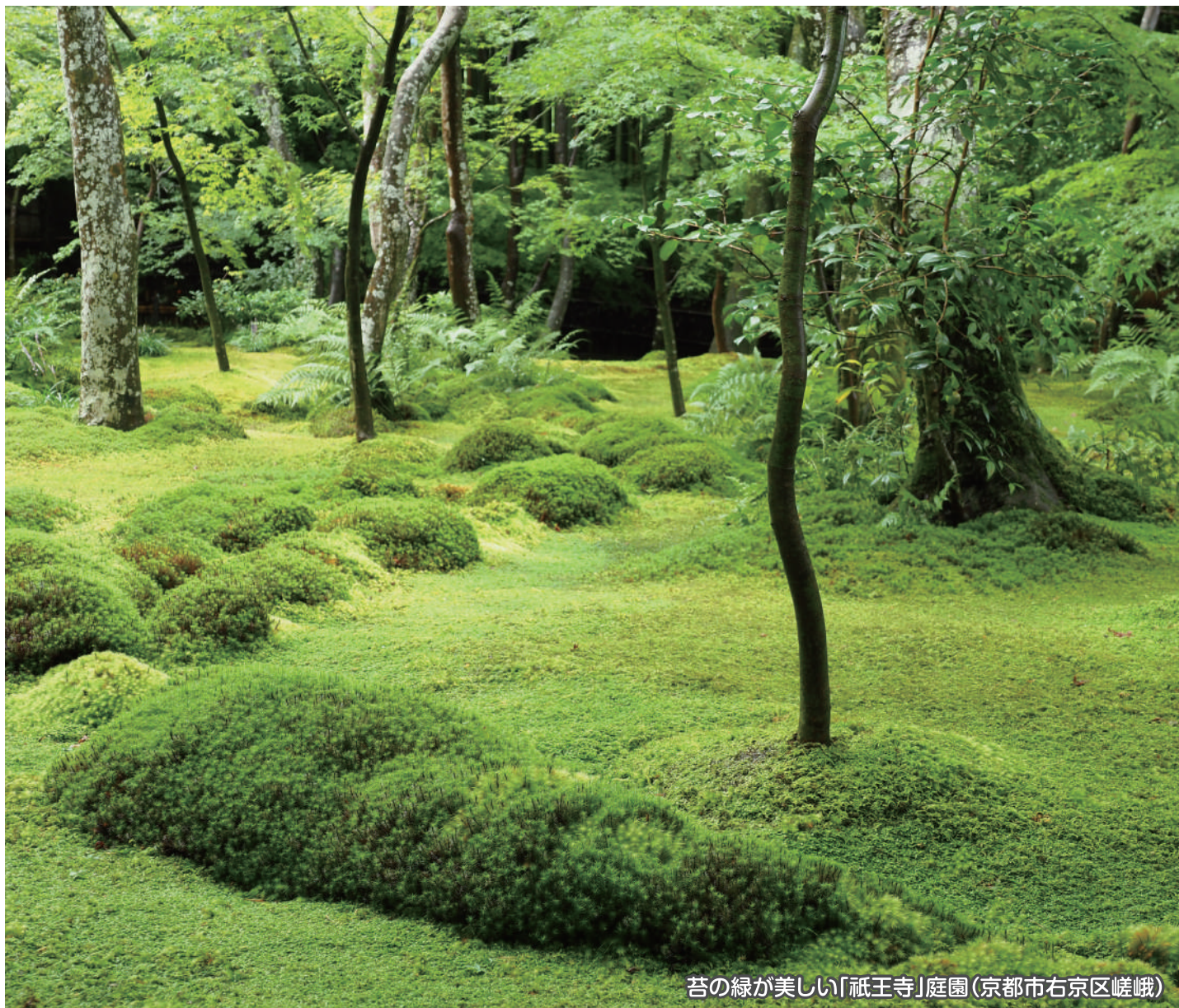
苔の緑が美しい「祇王寺」庭園(京都市右京区嵯峨)