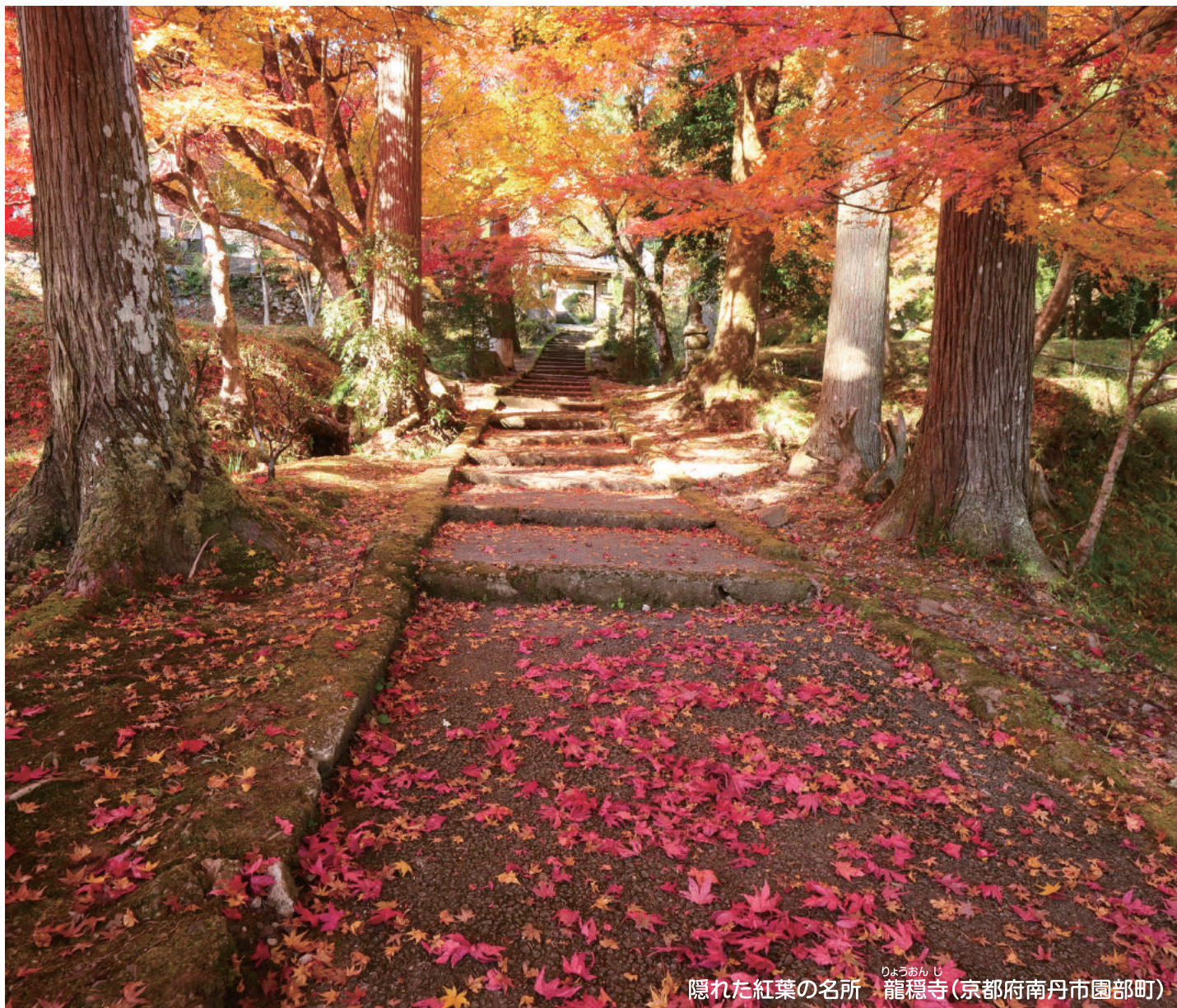
隠れた紅葉の名所 りょうおんじ 龍穩寺(京都府南丹市園部町)