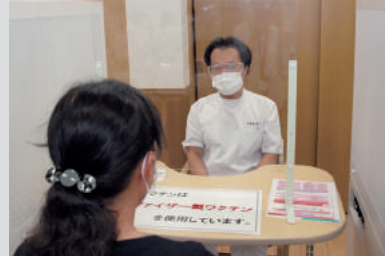
問診で医師の判断を仰ぎます