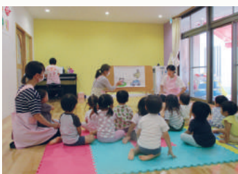
お誕生日会はみんなで楽しく