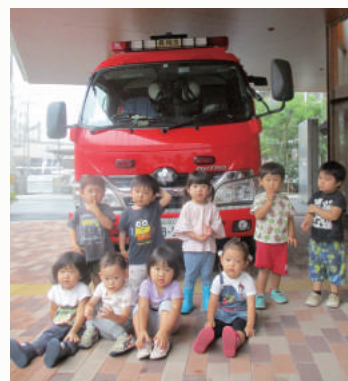
大きな消防署の前でみんなおすまし顔