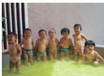
アトリエのプールで水遊び

園では、常に感染対策をしっかり講じて、健やかに成長できるよう、良質な保育を提供しています。