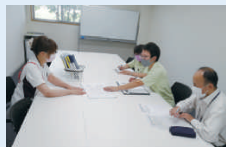
違う業種の監査を受ける施設看護師

また、毎年、全部門が相互で監査を行う、「内部監査」を実施するなど、常に一人一人がより良質を意識するように努めています。部門の違う多職種が評価者となることで、工夫のある取り組みや素晴らしい点を共有し、改善点へ目を向けるなど、相互のスキルアップを日々重ねております。