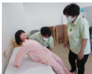
人形を使つての研修

このように、入職後のフォローアップ研修を実施することで、介護部門全体で均一な介護サービスを提供できるように努めています。