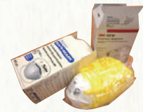
貴重な N95 マスクも 様々な方より頂きました