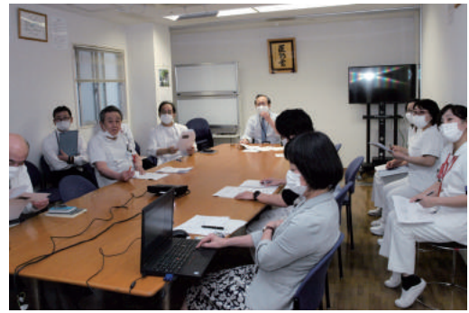
理事長、院長、Dr、関係部署で発表内容を精査

WEBという新しい形での発表にあたり、理事長、院長はじめ関係部署が関わる予演会を充分に行い、内容を精査した上で、20演題を無事提出いたしました。