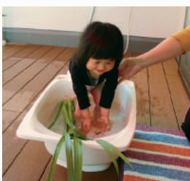
しょうぶ湯で元気に

コロナウイルス対応で、利用されている園児さんは少な かったのですが、明るい日差しのテラスにベビーバスを置 いて、お湯をはり、邪気を祓う薬草と言われてきた「菖蒲 の葉」を入れて、小さな菖蒲湯も作り ました。