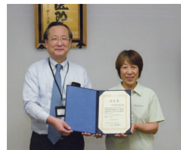
立派な認定証を手に理事長と記念撮影

これからも、介護スタッフ憧れのプロフェッショナルとして、全体のボトムアップに、自分磨きにと頑張ってください！