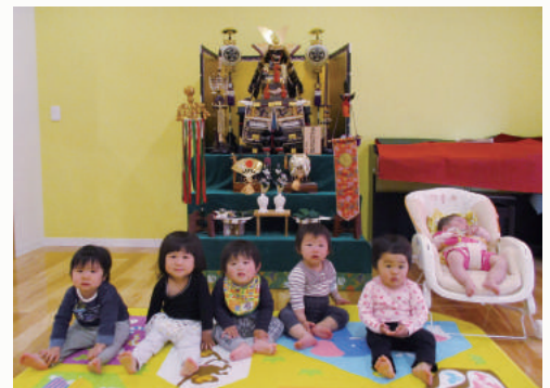
立派な大将人形の前で記念撮影

大きな大将飾りの前で、記念撮影をしました。園児さんの無邪気な笑顔 にきっと「邪気」も「コロナウイルス」も飛んでしまうことでしょう。