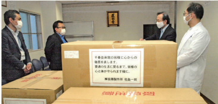
(株)皆藤製作所様(左側)より、多数の防護服や医療用ガウン等を頂戴いたしました