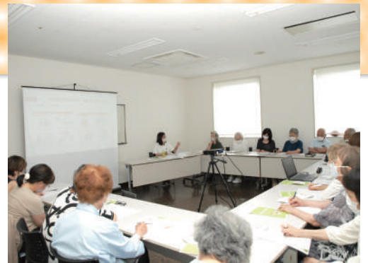
熱心に聴き入るご家族さま

今回は、「管理栄養士からの食事の工夫」がテーマとなります。今後も「口腔ケア」「保険制度」「更衣の工夫」「転倒予防」「移動・移乗」と様々なテーマにて、月 1 回開催いたしますので、お気軽に、最寄りの事業所にお問合せ下さい。