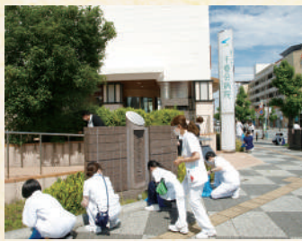
周辺清掃中の法人職員

今年も5月30日に長岡京市で取り組まれている「ゴミゼロ運動」に参画しました。千春会病院、JR長岡京駅周辺を看護師、セラピスト、管理栄養士等の法人職員が清掃活動を一斉に行いました。常日頃から周辺環境の整備に努めていますが、さらに意識を高められるよう、これからも協力してまいります。