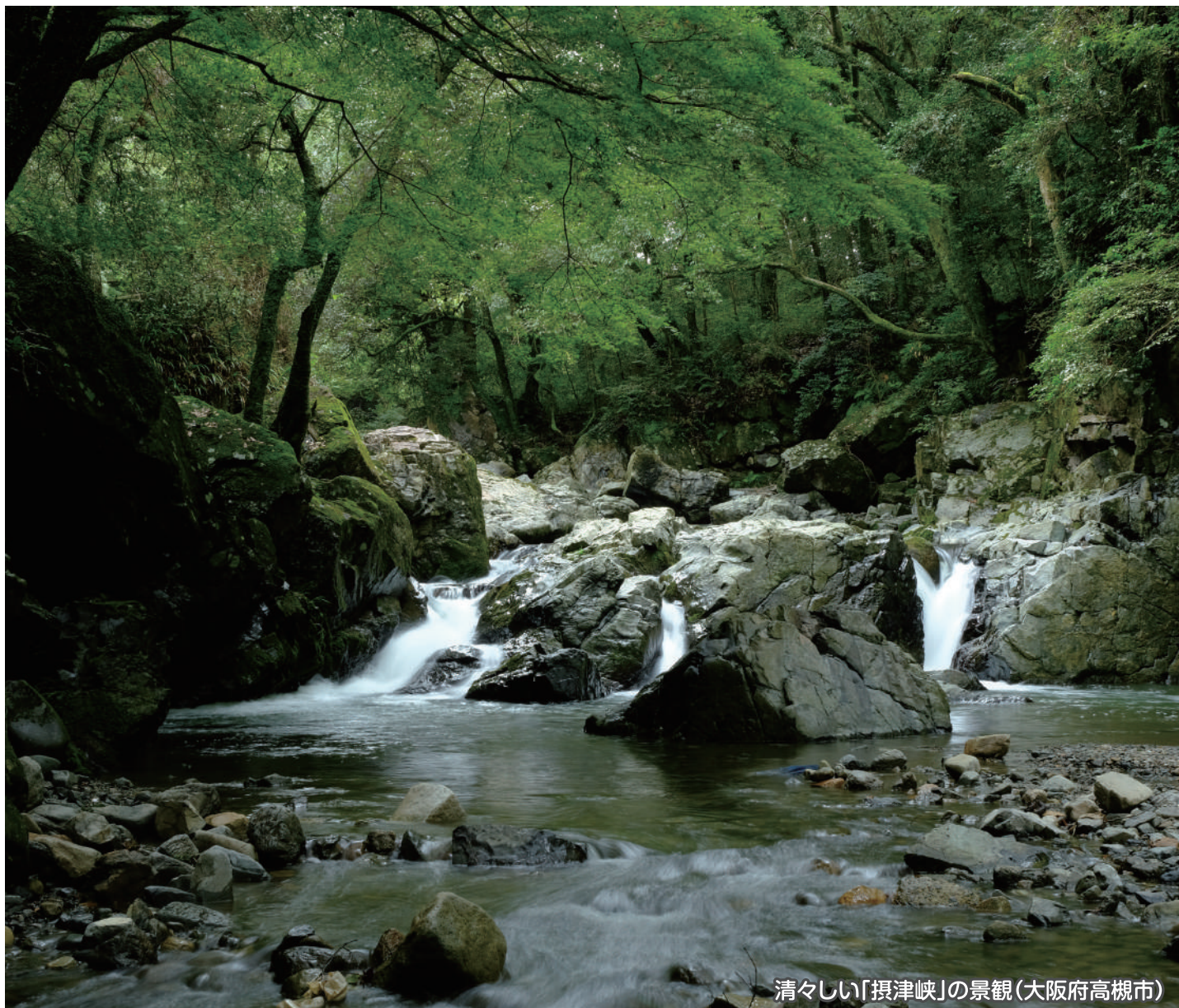
清々しい「摂津峡」の景観(大阪府高槻市)