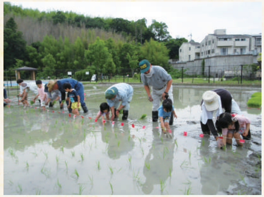
教わりながら田植えをする園児たち

きらら保育園の園児たちが、西代里山公園に田植えに伺い、お茶碗のお米は、ここから育つことを教えてもらいました。子どもたちは、「きゃー」と歓声を上げながら、憶することなく笑顔で、水を張った田んぼの泥の中に入り、嬉しそうに田植えをお手伝いしました。みどりの協会、農家有志の皆さんに教えてもらいながら、長岡京市職員も見守る中、小さな手で一株一株丁寧に苗を植える子どもたち。その真剣な姿は、可愛らしくも頼もしい助っ人でした。往復1時間も歩いた子どもたちですが、初めての田植え体験に「楽しかった!!」と、元気一杯でした。秋にはきっとおいしいお米が収穫できることでしょう。