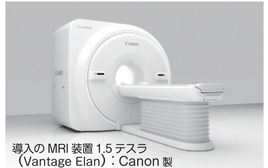
導入の MRI 装置 1.5 テスラ (Vantage Elan) : Canon 製