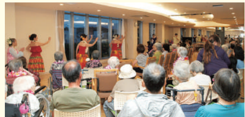
ボランティアさんによるフラダンス

桃山は、まだ2年目ながら、地域の認知度アップを示すように、今年は、去年より大勢の方で賑わいました。早くから近隣の方々がたくさんお越しになり、明るい雰囲気が始まりました。利用者さま、ご家族様の楽しそうな様子、地域のお子さんやご家族が次々来られ、2階デイケアでフラダンスが始まる頃には超満員のうれしい悲鳴。ボランティアさんによる心癒されるフラダンスにみなさん魅了されておられました。昨年の夏祭りよりも多くの方がお越しになりましたが、終始落ち着いた雰囲気の桃山でした。