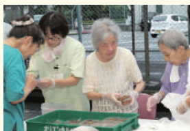
屋台でがんばる利用者さん

今年も驚くほど大勢の方々に賑わった夏祭り。地域の方々が家族連れで来られたり、子どもたちも多く来場されるのが「春風」の夏祭り。子ども向けのゲームや屋台では、たくさんのお子ど