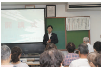
中小路市長ごあいさつ