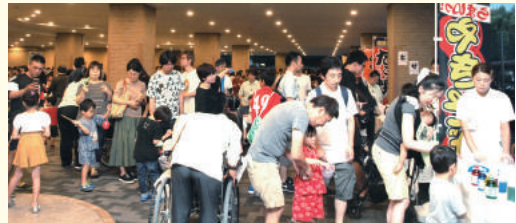
多くの人であふれるピロティ

もが集まり、実に楽しそう！地域になくはない「春風」に近づけたのではないかと思います。そして、昨年同様、利用者さんが屋台を担当し、それぞれの役割を笑顔で楽しんでおられる様子は、周りの人の笑顔と呼び、活き活きと元気いっぱい