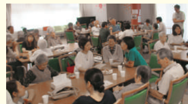
ご家族と楽しむ利用者さん

「介護複合施設 東向日」「介護複合施設 今里」「サービス付き高齢者向け住宅 パティナー 一文橋」「小規模多機能型居宅介護 あさつゆ」、デイサービス友岡・滝ノ町・風車でも夏祭りが開催されました。また、グループ法人和楽会の「保育・高齢複合施設 友岡」でも、かわいい浴衣姿のお子ど