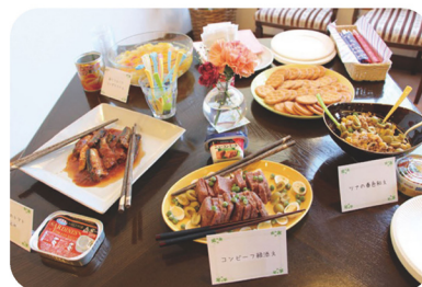
見事な盛りつけの防災食