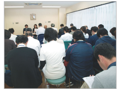
講評を受ける法人職員

今年も「より良質」を目指し、全職員で取り組んだ ISO 更新審査。日々の努力や成果はしっかりと評価され、「不適合指摘なし」との結果となりました。また、今後の地域医療構想をはじめ、医療計画、介護保険計画などの認識に基づく中長期経営計画については高い評価をいただき、労働時間管理や高齢者の積極的採用などの人材確保面や伝達講習などの充実によるスキルアップなど、制度や人的リスクを認識しての対処などが特に評価されました。これからも先を見据えた事業計画と毎日の地道な取り組みを重ねながら、さらなる良質を目指してまいります。