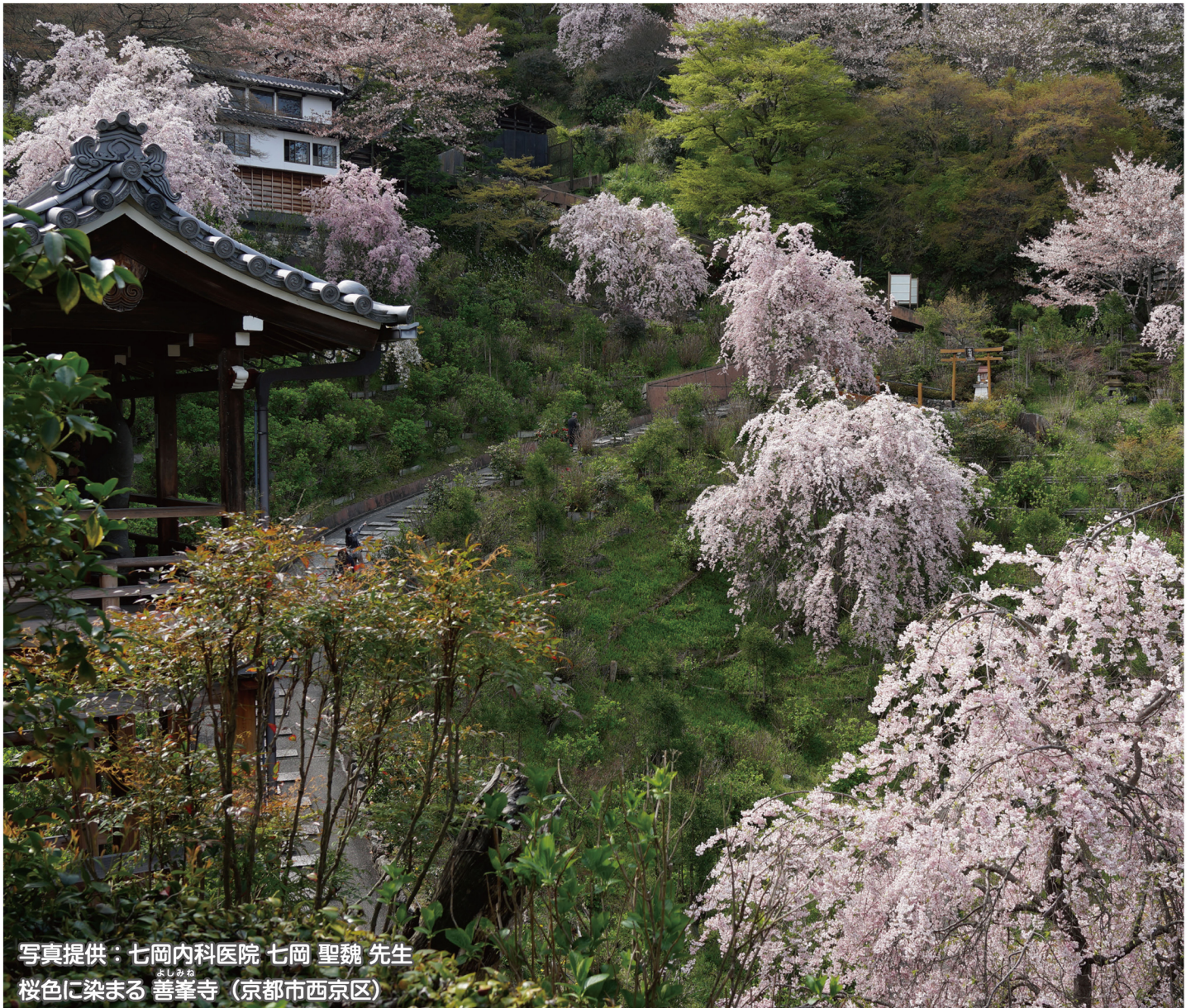
写真提供：七岡内科医院 七岡 聖魏 先生 桜色に染まる 善峯寺 (京都市西京区)