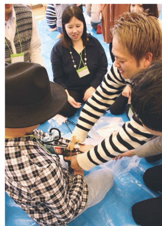
仲良く救助ゲーム