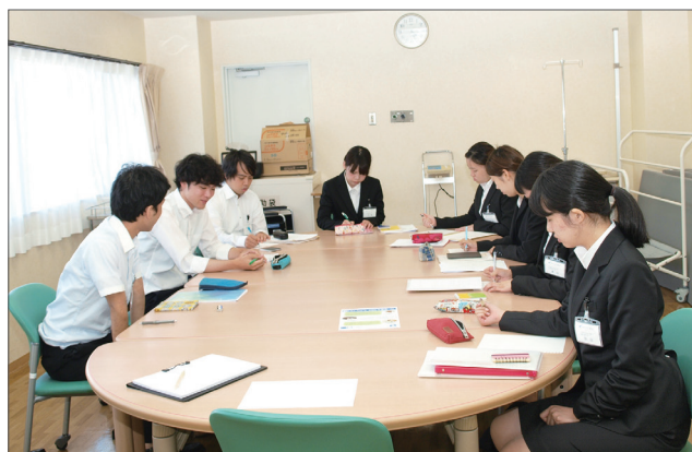
与えられた課題に真剣に取り組む大学生たち

大学生たちの成長を見るにつけ、法人としても多忙な中で受け入れすることの意義を感じます。若い方々の将来への一助として、これからも協力してまいります。