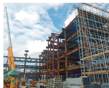
広がりを見せる現場 (9月27日)

高い鉄骨が立ち上がり、大きさや高さがある程度確認できるよ うになり、外壁まわりの花壇の整備も進んできました。近隣の 方々への配慮にも意を用いつつ、暑い中、現場で作業する方々の 安全を確保していただき、慎重に工事を進めております。