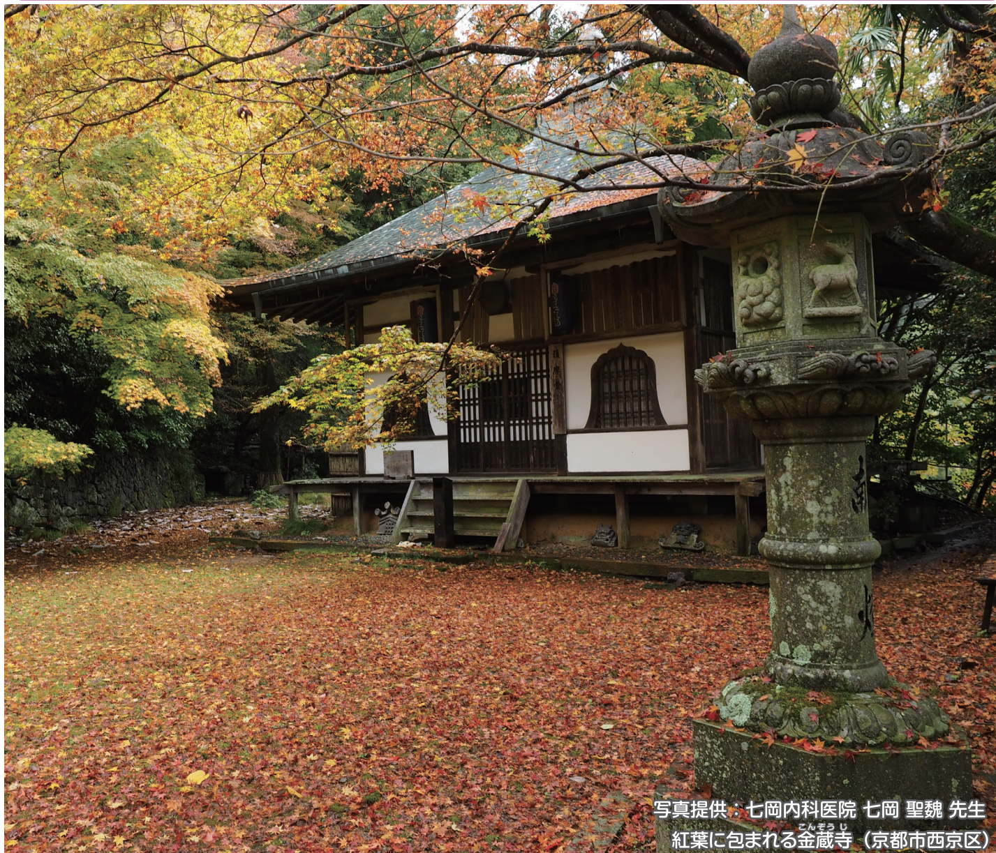
紅葉に包まれる金蔵寺 (京都市西京区)