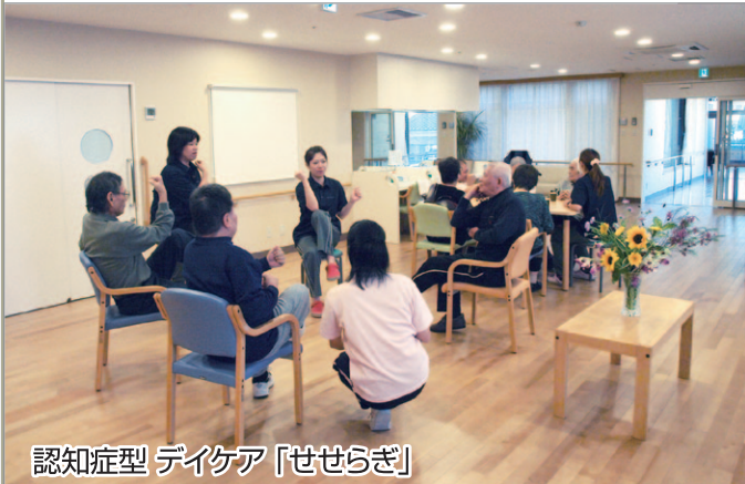
認知症型 デイケア「せせらぎ」

介護老人保健施設 春風では、2名の言語聴覚士 (ST) が関わり、作業療法士 (OT)、理学療法士 (PT) などのセラピストと共に、さらに充実したリハビリを提供しています。言語聴覚士は、昼食時に全ての利用者さまに嚥下機能の評価や機能訓練のアドバイスを行い、誤嚥性肺炎などのリスク軽減にも努めています。また、回復に時間を要する「脳血管障害後の失語症」や「構音障害(ろれつが回らない)」「高次機能障害」「パーキンソン病などによる音声障害」の方なども、回復に向けての機能訓練を継続して行っています。