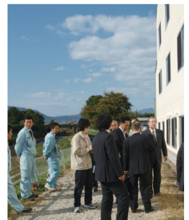
外周確認中の理事長(右)、法人関係者

千春会は、「医療と介護の連携」を密にした万全のサポート体制を備え、「その方らしい暮らし」を大切にした「安心の住まい」を提供してまいります。