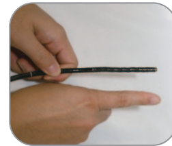
細径内視鏡 (外径 5.0mm) オリンパス GIF-XP260N