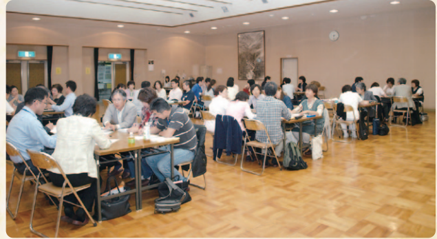
多職種による活発なグループディスカッション

地域に暮らす方々を医療・介護関係者全員でサポートすべく、真剣な意見交換がなされ、多職種ならではの実に有意義な会となりました。