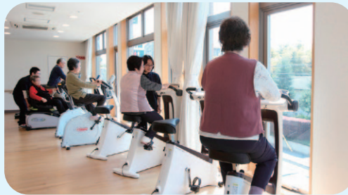
予防型(デイケア)「あお空」