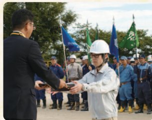
表彰されるメンバー代表

開会式では、千春会による「選手宣誓」の後、男女ともに、きびきびとした動きで鎮火し、技術向上が見られた競技会となりました。これからも常に防火活動に努め、さらに気持ちを引き締めてまいります。