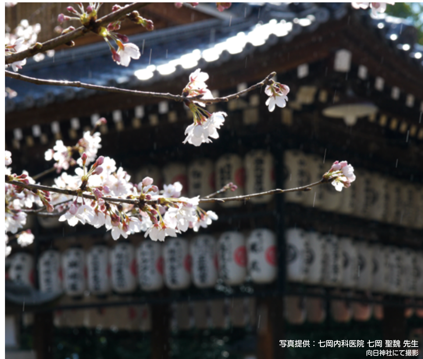
写真提供：七岡内科医院 七岡 聖魏 先生 向日神社にて撮影