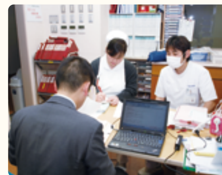
透析審査中のサーベイヤー

初めての受審となる「ハイパーサーミアクリニック」においても「審査対象事例では、ガン難民と呼ばれる方々の一助となるべくという理事長の理念が、現場で実践されている優れた例であった」と高い評価をいただきました。