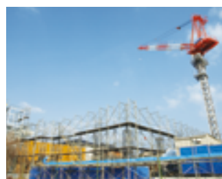
2月24日 高いクレーンが立つ建設予定地